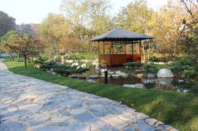
Tadilat Sonrası Bahçenin Genel Görünümü

Baltalimanı Japon Bahçesinin bu seferki onarımında İstanbul Büyükşehir Belediyesi tarafından Shimonoseki Belediyesine onarım işbirliği talebi alınarak, Japonya tarafından gönüllü Japon firmaları tarafından 'Baltalimanı Japon Bahçesi Onarım Projesi Komitesi'ni kurdu ve Shimonoseki Belediyesi Bahçe Düzenleme Kulübü yetkilileri tarafından İstanbul'a ziyaret yapılarak , İstanbul Büyükşehir Belediyesi Park Bahçe ve Yeşil Alanlar Daire Başkanlığı yetkilileriyle beraber, taşlı yolların yenilenmesi, fidan dikimi, çim alanların yenilenmesi, bahçe etrafındaki çitlerin düzenlenmesi gibi çalışmalar yapıldı. Ayrıca bu tadilatla çay evinin iç kısmı da estetik bir düzenlemeyle yeniden doğmuş gibi oldu.