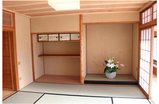
Çay evinin salonu

Tören sonrasında bahçenin yeniden açılmasını bekleyen çok sayıda İstanbullu bahçeyi ziyaret ettiler. Baltalimanı Japon Bahçesi, yıl boyunca her gün 07.00-17.00 saatler arası açıktır ve giriş ücretsizdir.(Bahçe yönetimi İstanbul Büyükşehir Belediyesi Parklar ve Bahçeler Müdürlüğü tarafından yapılmaktadır) Herkesi bu güzel bahçeye bekliyoruz.