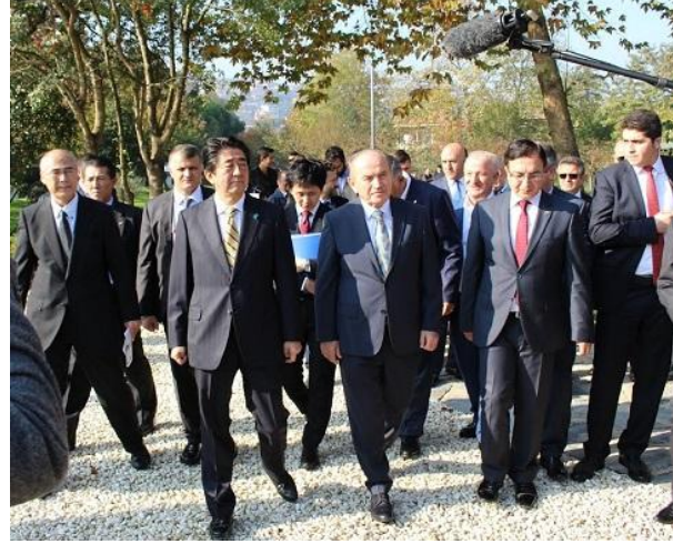
Bahçeyi Gezen Başbakan Abe ve Katılımcılar

Baltalimanı Japon Bahçesinin bu seferki onarımında İstanbul Büyükşehir Belediyesi tarafından Shimonoseki Belediyesine onarım işbirliği talebi alınarak, Japonya tarafından gönüllü Japon firmaları tarafından 'Baltalimanı Japon Bahçesi Onarım Projesi Komitesi'ni kurdu ve Shimonoseki Belediyesi Bahçe Düzenleme Kulübü yetkilileri tarafından İstanbul'a ziyaret yapılarak , İstanbul Büyükşehir Belediyesi Park Bahçe ve Yeşil Alanlar Daire Başkanlığı yetkilileriyle beraber, taşlı yolların yenilenmesi, fidan dikimi, çim alanların yenilenmesi, bahçe etrafındaki çitlerin düzenlenmesi gibi çalışmalar yapıldı. Ayrıca bu tadilatla çay evinin iç kısmı da estetik bir düzenlemeyle yeniden doğmuş gibi oldu.