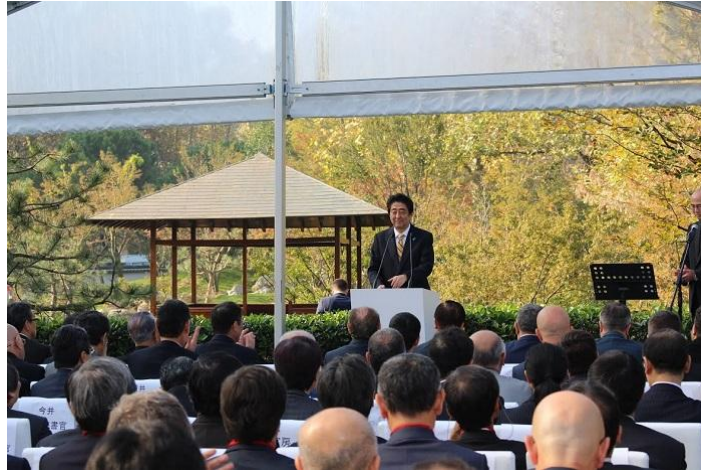
Japonya Başbakanı Abe'nin konuşması

Japonya İstanbul Başkonsolosu Ehara açılış konuşmasını yaparak 'Baltalimanı Japon Bahçesi Onarım Projesi Komitesi'ni temsilen Taisei İnşaat Yönetim Kurulu Başkanı Yamauchi'nin konuşmasının ardından, törenin ortak düzenleyicisi de olan İstanbul Büyükşehir Belediyesi Başkanı Topbaş ile son olarak Başbakan Abe birer konuşma yaptılar.