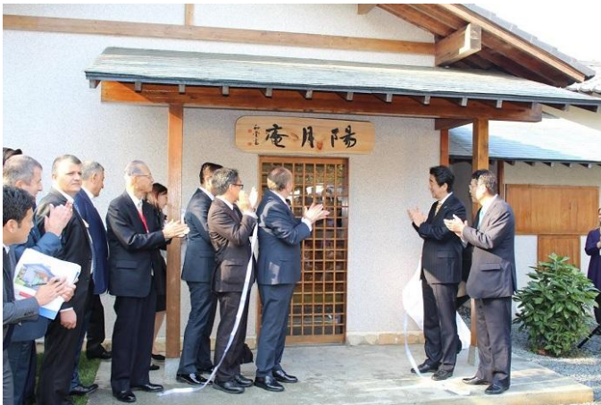
Yogetsuan tabelası perde açılışı

Devamında, tadilat gören çay evi Yogetsuan olarak isimlendirilerek önündeki tabelanın açılışı yapıldı Yogetsuan iki ülke bayraklarının sembolü sayılan güneş (Japonya) ve ay(Türkiye) ile iki ülkenin ebedi dostluğu dilekleriyle isimlendirilmiştir.